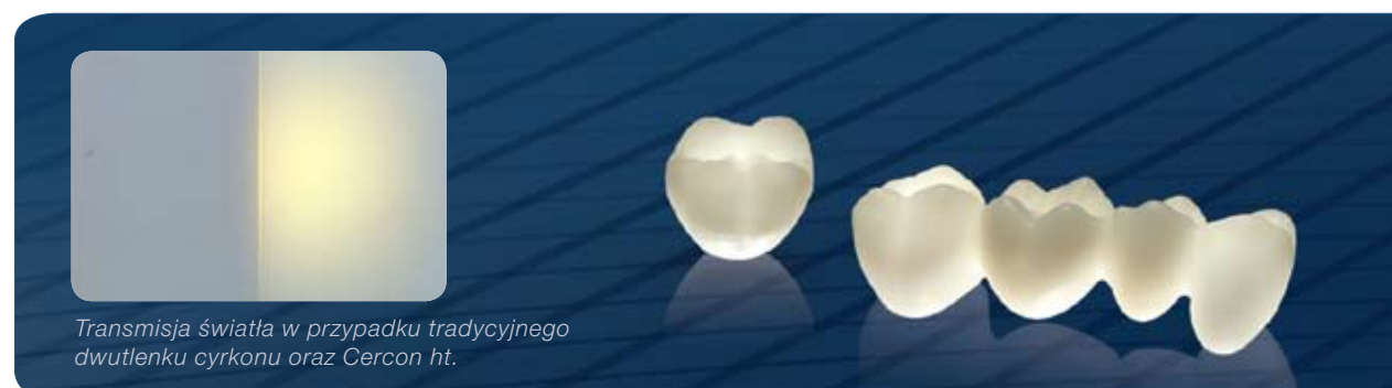
Transmisja światła w przypadku tradycyjnego dwutlenku cyrkonu oraz Cercon ht.

Cercon ht oferuje doskonałą translucencję